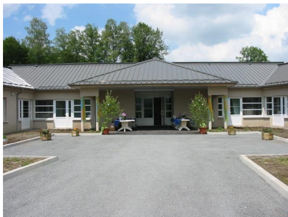
La résidence du Lac – MAS de 24 places